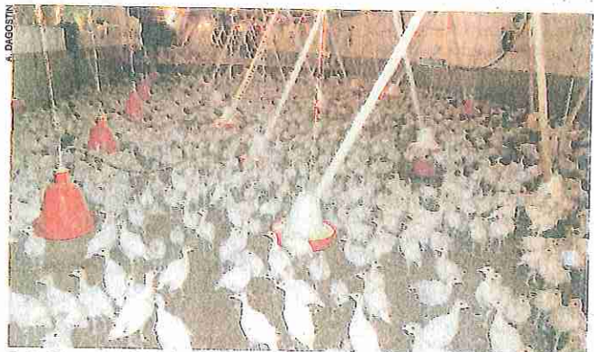
Pazinski purani na farmi Skropeti