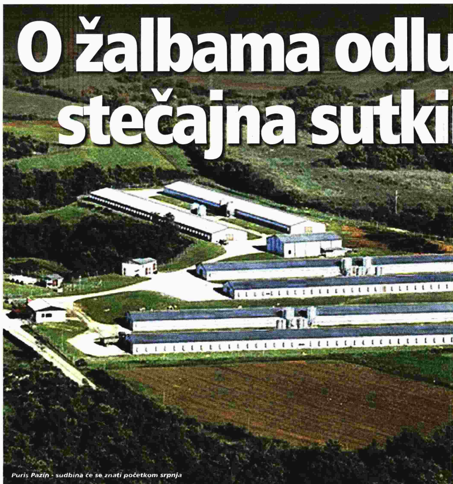
Puris: Pazin - sudbina će se znati početkom srpnja