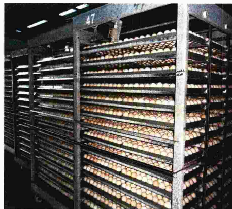
VALIPILE ima više od 23 godine iskustva u peradarskoj industriji

Predstavnici tvrtke Valipile, tvrtke čiji je temeljni kapital 19,5 milijuna kuna u usporedbi s Genezinim pola milijuna kuna i koja je za Puris planirala jamčiti svojom cjelokupnom imovinom u iznosu od 87 milijuna kuna za razliku od Genezinog plana koji je uključivao osnivanje nove tvrtke s temeljnim kapitalom od 25 tisuća kuna uz jamstva zadužnicama, sada sumnja-